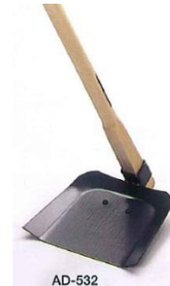
側溝泥すくい (ジョレン)