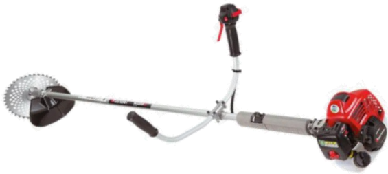
草刈り機 (2st エンジン) ※ナイロン刃に変更