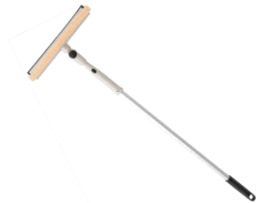
窓拭きワイパー (長さ 5m)