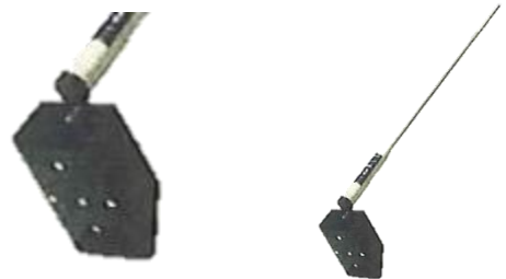
側溝泥すくいスコップ (大) 155mm