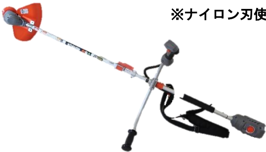
草刈り機 (バッテリー式) ※ナイロン刃使用