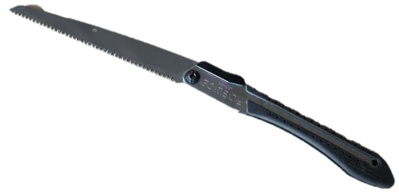
ノコギリ (片手持ち)