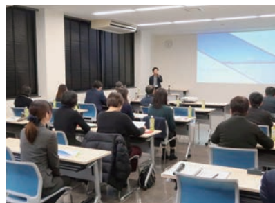
でんさい活用研修