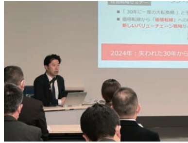
ビジネススクール特別講演会

また、高付加価値化のカギ は「人」であるとし、「採用 ↓育成↓活躍↓定着の好循環 をつくっていくかなければ企業