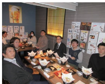
レクリエーション事業について意見交換

3月22日(金)に「肴ダイニング心」にて第3回問屋町従業員モニター会議を開催し、9名が出席した。 会議では今年度のレクリエーション事業の反省点や次年度に向けた企画案などについて意見交換した。