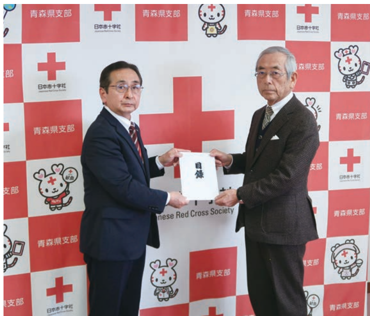
日本赤十字社に能登半島地震義援金を寄託

日本赤十字社によると3月8日時点で1万人以上の避難者があり、断水も1万7千戸を超え、停電戸数も約260戸と石川県の一部では多くの人がいまだに日常生活を取り戻せずにいる。