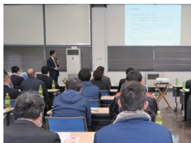
卸団地の景観再整備計画を説明

J R青森駅東口ビルは旧青森駅東口駅舎跡地に建設された地上10階建の商業施設。1