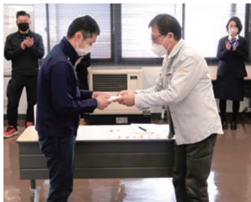
賞品を受け取るチーム代表者(左)

主な案件審議は次のとおり。 案件一 組合管理施設解体工事の施工業者決定について 案件二 会計システムの買替えについて