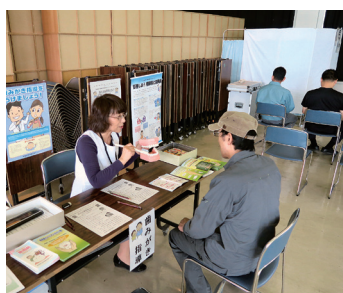
歯の健康相談コーナー

今後、短命県返上の一助となるよう、青森市南部の健康づくりの拠点として積極的に健康事業に取り組み。