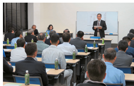
安協 第45回定時総会

町東口及び第二問屋町北口、青森中央卸売市場前歩道花壇にマリーゴールドやラベンダー等、色とりどりの花苗840potを植栽した。 当日は天候に恵まれ、問屋町の景観向上に向け、参加者は額に汗を浮かべて作業した。