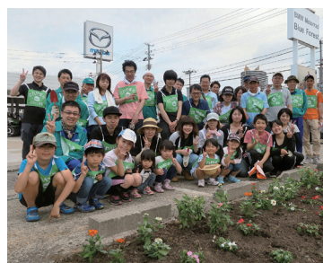
問屋町緑のボランティア隊

問屋町緑のボランティア隊の今年度1回となる活動が6月24日(日)に実施された。同隊隊員38名が参加した今回の作業は花苗の植栽。問屋