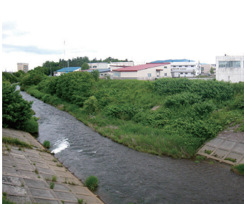
荒川河川敷（伐採前）

組合では、今年度1回目となる集団健康診断を実施した。6月12日（火）から14日（木）の3日間、問屋町会館2階大会議室で行われた同健康診断には、組合員をはじめ近隣企業からも数多く参加し、308名が受診した。