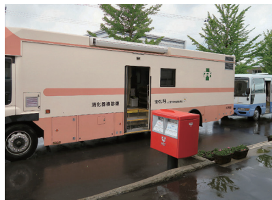
専用バスで胃部レントゲン検査

このたび、問屋町と第二問屋町の間を流れる荒川の河川敷の雑木が伐採された。河川敷の雑木は景観を損ねるほか、アメリカシロヒトリなどの害虫被害も引き起こすなど問題となっていた。また、雑木の放置は、洪水時に流れをせき止めたり、流された樹木が堤防や護岸などに損傷を与えるなど河川の管理上好ましくない。そこで、荒川を管理する東青地域県民局では数年一度、河川敷の雑木を伐採している。