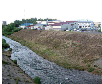
荒川河川敷（伐採後）

このたび、問屋町と第二問屋町の間を流れる荒川の河川敷の雑木が伐採された。河川敷の雑木は景観を損ねるほか、アメリカシロヒトリなどの害虫被害も引き起こすなど問題となっていた。また、雑木の放置は、洪水時に流れをせき止めたり、流された樹木が堤防や護岸などに損傷を与えるなど河川の管理上好ましくない。そこで、荒川を管理する東青地域県民局では数年一度、河川敷の雑木を伐採している。