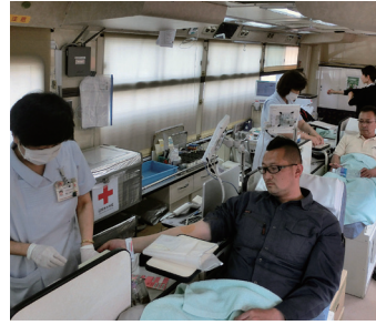
献血バスによる献血

今年度1回目の献血が、5月25日(水)、午前11時30分から午後1時に問屋町会館前で行われ、組合員従業員ら14名が協力した。