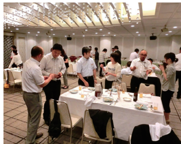
若手従業員親睦交流会 (昨年)