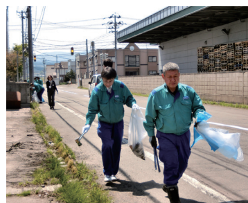
ユアテック清掃活動

指す。また、昨年度策定した地方創生策レポートに基づき、人材育成支援やオール青森体制及び呼びかけ機能の構築、また流通コーディネートプラットフォーム機能の創設も目指す。 その他、経年劣化により沈下した共同倉庫B棟及び共同配送センターの床補正工事を実施するほか、既存中古物件等の計画的なメンテナンスも行っていく。 問屋町ゴールドカード事業では、同事業が平成19年度からスタートし今年で10年目を迎えることから、10周年記念キャンペーンを実施し、勧誘活動を推進する。 健康事業では、これまでの事業に加え、新たに青森市や「健やか力推進センター」などと連携したセミナー等を実施する。 安心・安全な街づくりを目指して検討を続けてきた防犯カメラの設置について、今年度、実験的に幹線道路主要箇所へ設置する。