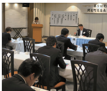
青友会第9回定時総会