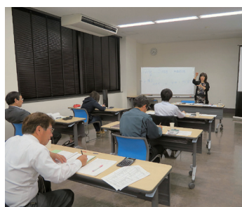
これから学ぶ会計・経理

「営業力に頼らないで売れる販売戦略」は3月まで全6回のシリーズ開催。昨年度からは年間パスポート制度(全6回受講申込で受講料が割安)