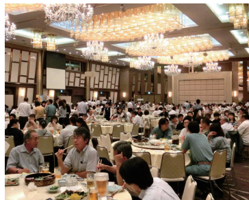
納涼パーティー (昨年)