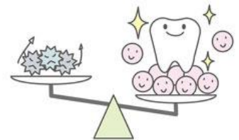
善玉菌と悪玉菌のバランスが大事