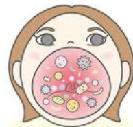
口の中には細菌がいっぱい!

「腸内フローラ」という言葉を耳にしたことがあるかと思いますが、実は、口の中にも数多くの善玉菌と悪玉菌が存在する「口内フローラ」があり、そのバランスが私たちの健康を大きく左右していることが最近の研究でわかってきました。