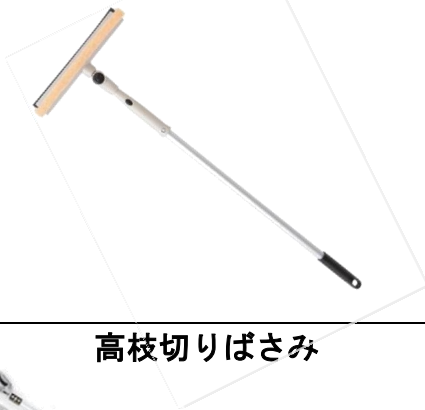
窓拭きワイパー (長さ 5m)