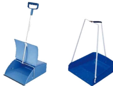
チリトリ（文化型・三つ手型）