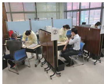
ブースに仕切ってワクチン接種

ハラスメントは拒否や抵抗がなかったとしても該当し得る。また、異性に対してだけでなく同性に対しても該当し、昨今ではLGBTに対する配慮も求められている。判断にあたっては、被害にあった労働者の主観を重視しつつも平均的な労働者の感じ方を基準とするなど一定の客観性が必要」と話した。 また、パワーハラスメントについては「上司から部下へという場合が多いが、その部署において経験豊富な部下から経験の浅い上司へのパワーハラというのものもある。誰でもパワーハラの加害者になり得る」と注意を促した。 ハラスメント問題が企業に与える影響には①職場の士気の低下、人材流出②被害者の精神疾患等の発症③損害賠償リスクなどがあり、賠償額は昨今高額化の傾向にあるとのこと。 最後に「企業は予防策として、ハラスメントの内容と自社の方針を明確にした上で社内周知・啓発する。また相談窓口を設置し、問題が発生した際は迅速かつ適正な対応がとれる体制整備が求められる」とまとめた。