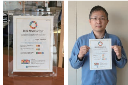
SDGs宣言企業には宣言書を贈呈

防災訓練実施・防災品を備蓄します」や「ペットボトルキャップを回収しワクチン募金へ寄付します」などを宣言。その他の企業では「水や電気の使用量を削減します」「ノ