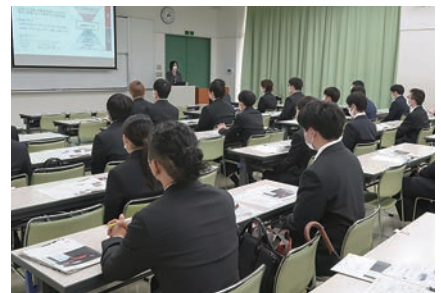
合同企業セミナー

0名の学生が参加した。当日は、1社1教室利用、参加人数の制限、マスク着用、検温や手指消毒等の新型コロナウイルス感染症防止対策を徹底して実施された。