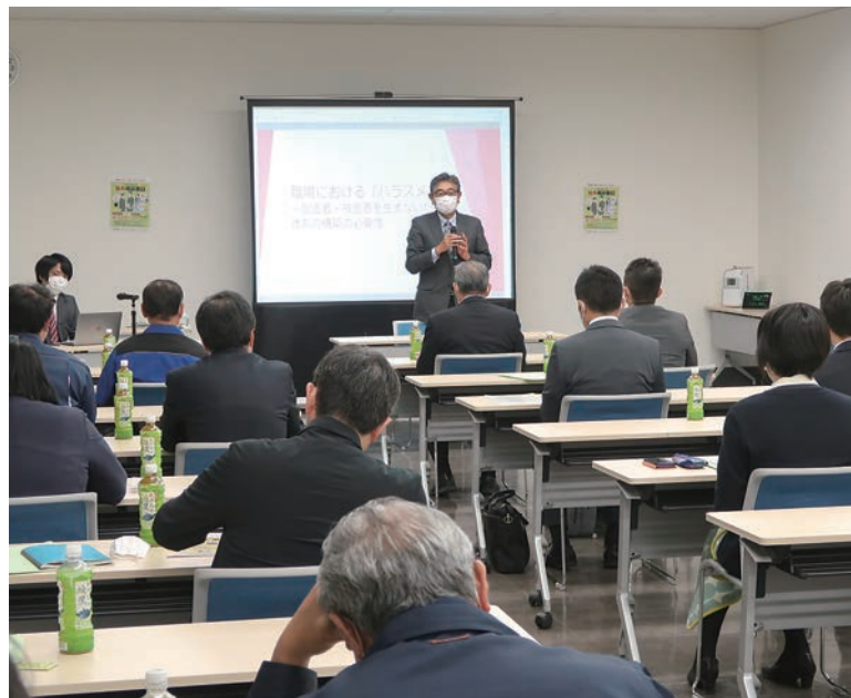
ハラスメント対策セミナー

編集・発行 協同組合青森総合卸センター 〒030-0131 青森市問屋町2丁目17-3 ☎017-738-4711 FAX017-738-7323 URL https://www.tonyamachi.com E-mail info@tonyamachi.com 発行/2021年11月30日