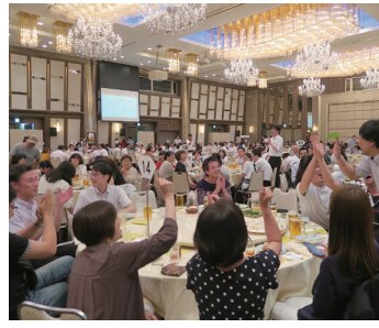
昨年の納涼パーティーの様子