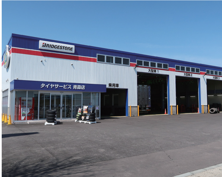
ブリヂストンタイヤサービス東日本(株)青森店

編集・発行 協同組合青森総合卸センター 〒030-0131 青森市問屋町2丁目17-3 ☎017-738-4711 FAX017-738-7323 URL http://www.tonyamachi.com E-mail info@tonyamachi.com 発行/2019年4月26日