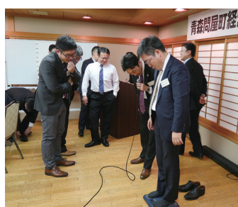
体重測定するグランプリ参加者

る舞を通じて人を思いやる心や礼儀作法を養い、歴史や伝統文化への理解を深めてもらう会。最近では地域イベントやテレビ番組に出演するなど活躍の幅を広げている。